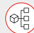
MODULO Creazione Progetti con Integrazione Software CAD Project creation with CAD Software Integration MODULE