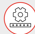
MODULO Gestione Produzione Production Management MODULE