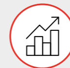
MODULO Analisi e Statistiche Avanzate Advanced Analysis and Statistics MODULE