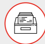
MODULO Gestione Schede Tecniche Technical Sheet Management MODULE