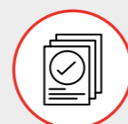
MODULO Creazione Commesse e Preventivazione Order Creation and Estimating MODULE